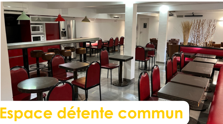
Espace détente commun